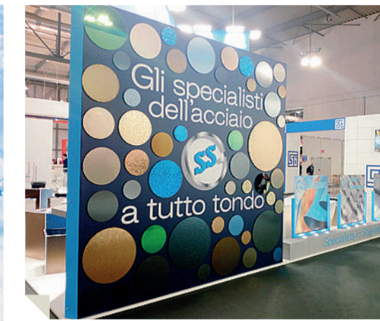
Sopra, lo stand di Steel Service durante l'edizione 2019 della fiera internazionale dell'acciaio Made in Steel, Milano. A sinistra MoPOP, Museum of Pop Culture di Seattle: l'edificio è stato progettato dall'architetto Frank Gehry, realizzato con acciaio inox colorato ColourTex®