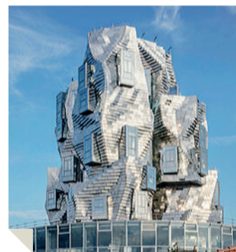
Sopra Arts Resource Center, torre della Luma Arles Foundation, a Zurigo. Progetto di Frank Gehry, realizzata con acciaio inox decorato Linen. Di notte e di giorno, per sottolineare come il materiale gioca con l'ambiente e con la luce creando riflessi e colori differenti

Metals UK, a cui Steel Service è legata dal 2012 con un contratto di vendita con esclusiva sul mercato italiano.